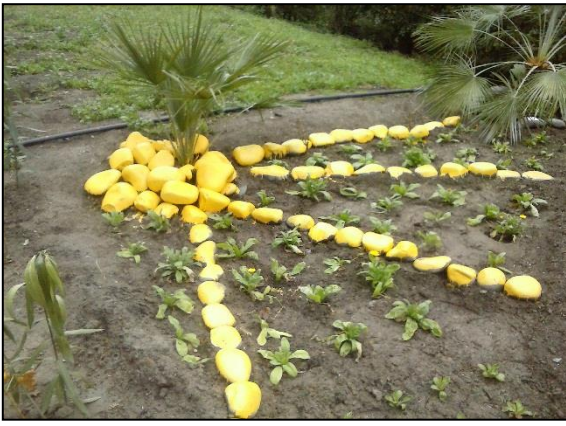
Şəkil 3. Orijinal forma