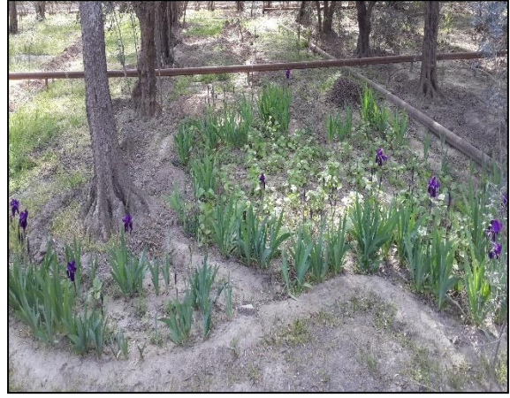
Şəkil 2. "Azərbaycan xəritəsi" forması