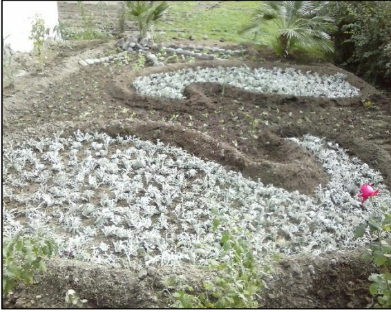
Şəkil 1. "Butalar" forması