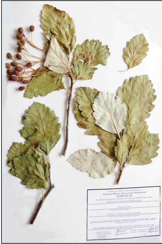
S. caucasica Zinserl. - Qafqaz quşarmudu

Tipus: Кавказ, г. Бештау, 1300 м над ур. моря, 23.V.1887, И.Акинфиев (holo, LE).