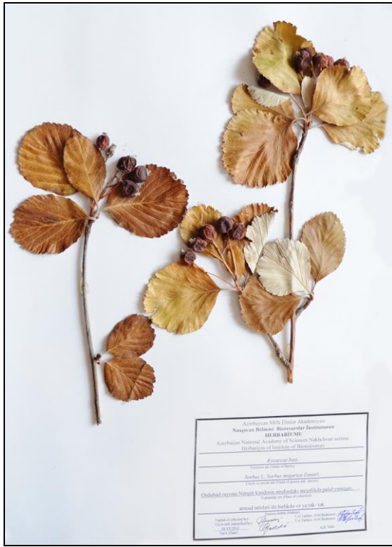
S. migarica Zinserl. - Miqariya quşarmudu

Гач. Дендрофл. Кавк. IV (1965) 115, рис. 19, 1 (fol.). - S. aria auct. non Crantz: Альбов, Тр. Тифл. бот. сада 1 (1895) 70, (Prodr. Fl. Colch.). - S. graeca auct. non Hedl.: Зайконн. Бот. журн., 1973, 10:167 - Miqariya quşarmudu.