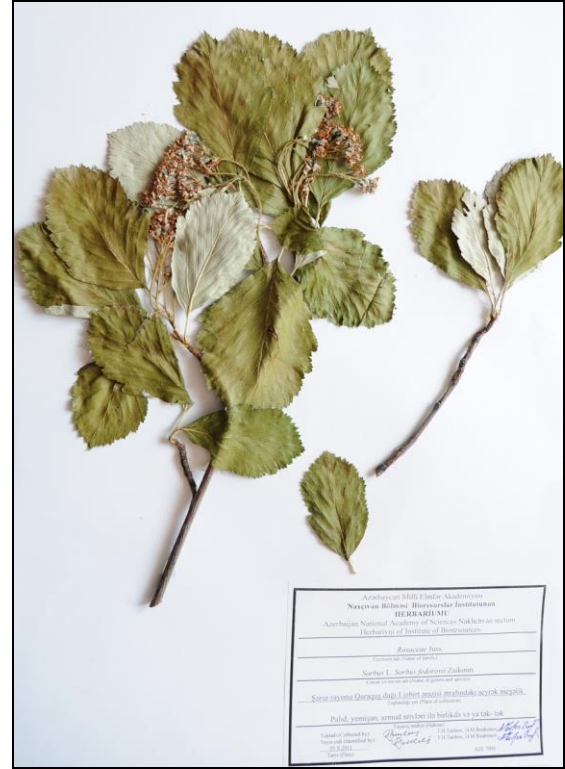
S. fedorovii Zaikonn. - Fyodorov quşarmudu

Tipus: Ossetia Australis, Ermani, in latere sinistro angustiae fl. Bolschaja Liachva, prope pagum Schavlochovo, 13.VII.1938, defl., fr. immat., L.I.Abramov (LE).