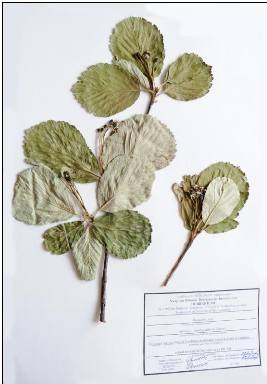
S. albovii Zinserl. - Albov quşarmudu

(Заиконникова, 1976) onu sərbəst növ kimi qəbul etmişdir. İ.T.Zaikonnikovaya (Заиконникова, 1980) görə S.albovii Zinserl. və S.subfusca (Ledeb.) Boiss. növlərinin müstəqilliyi onların coğrafi yayılması və xromosom sayının müxtəlifliyi ilə də təsdiq olunmuşdur. Belə ki, S.albovii Zinserl. növünə demək olar ki, bütün Qafqazda rast gəlinməsinə baxmayaraq, S.subfusca (Ledeb.) Boiss. növünün arealı Qafqazın qərb hissəsi ilə məhdudlaşır. Həmçinin, S.albovii Zinserl. növü tetraploid ( 2n=68 ), S.subfusca (Ledeb.) Boiss. isə diploiddir ( 2n=34 ). Bu növlər həmçinin, morfoloji əlamətlərinin müxtəlifliyinə (yarpağın formasına, ölçüsünə, kənarına və s.) görə də fərqlənirlər. Bu səbəbdən də S.albovii Zinserl. növünün S.K.Çerepanovun (Черепанов, 1995) da qeyd etdiyi kimi sərbəst növ olaraq qəbul olunması daha məqsəduşundur.