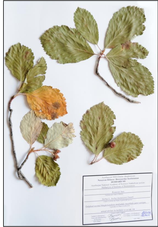
S. kusnetzovii Zinserl. - Kuznetsov quşarmudu

Yayılma yeri. Muxtar respublikanın Şahbuz rayonunun Biçənək kəndi ərazisində palıd meşəliyi 09.VIII.2013. T.H.Talıbov, Ə.M.İbrahimov; Ordubad rayonunun Nürgüt kəndi ətrafındakı seyrək meşəlikdə palıd, yemişan, alma, armud, itburnu, murdarça və s. növləri ilə birlikdə və ya tək-tək 04.IX.2015. T.H.Talıbov, Ə.M.İbrahimov.