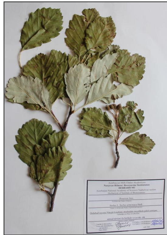
S. armeniaca Hedl. - Erməni quşarmudu

Qaidəyə yaxın hissə dərinləşmişdir. Yuxarısı sivri və ya az-az hallarda kütür, 6-8 sm uzunluqda, 3,5-5,0 sm enində olub, kənarı çox dərin olmayan 5-7 dilimlidir (aşağı dilimlər yarpaq ayası eninin yarısının 1/2-1/3 hissəsinə qədər çatır). 30-36 sivri dişi vardır. Üstdən tünd yaşıl və çılpaq, altından bozuntul və ya ağ rəngli sıx keçətükcüklüdür. Yan damarlarının sayı 9-10 cütdür, onlar yarpağın altında aydın seçilir. Çiçək qrupu çoxçiçəklidir. Kasacığın kənarları sivri üçbucaq şəklindədir. Ləçəkləri ağ, yumurtavardır. Meyvələri 1,0-1,2 sm uzunluğunda, 0,8-1,1 sm enində olub, oval və ya dairəvidir, yanlardan azacıq basılmışdır, tək-tək və ya 3-7 ədədi birlikdə qalxanlarda toplanmışdır. Yetişmiş meyvələri qırmızı olub, quruyanda göyərir. May-iyun aylarında çiçək açır, sentyabr-oktyabrda meyvələri yetişir.